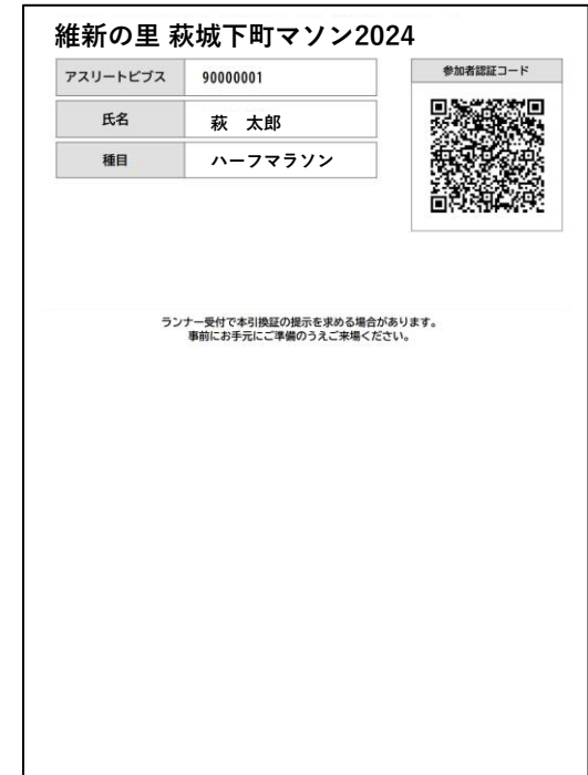
【紙でプリントアウト】